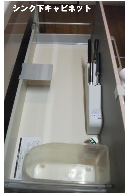
シンク下キャビネット