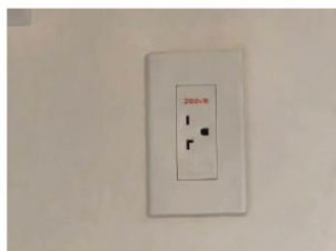
①室内機のコンセント