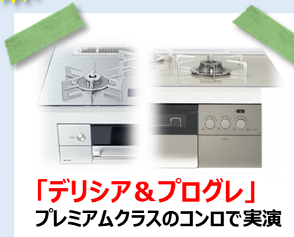
「デリシア&プログレ」 プレミアムクラスのコンロで実演